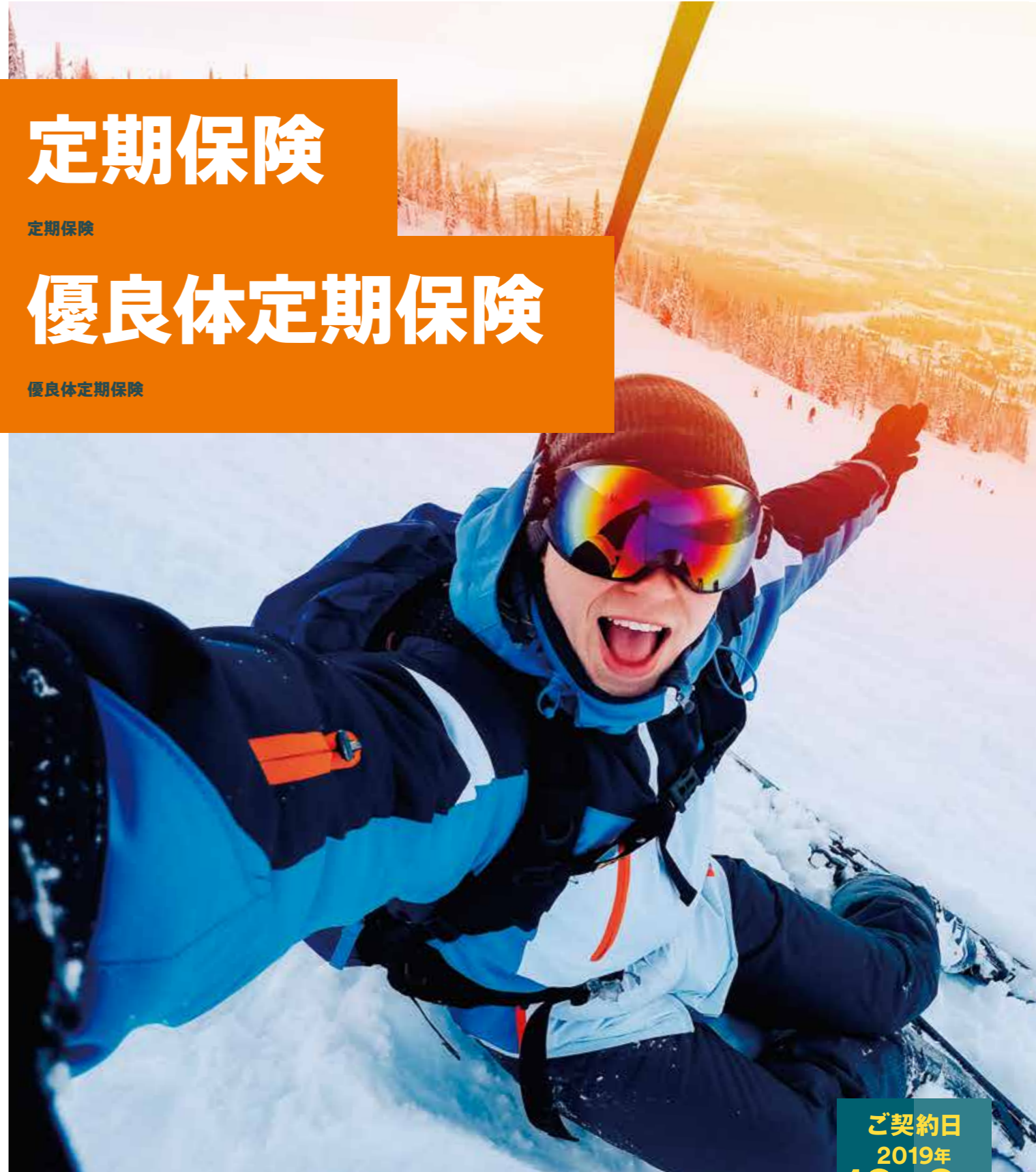
定期保険 | 2019年10月改訂